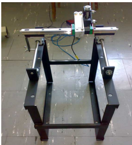
Rys 2. Prototyp urządzenia

wspomnieć, że projekt ten jest kontynuacją wieloletniej, dobrej współpracy pomiędzy naukowcami z obu uczelni tj. Politechniki Śląskiej w Gliwicach, reprezentowanej przez Katedrę Mechaniki Stosowanej a Katedrą Fizjologii Śląskiego Uniwersytetu Medycznego w Katowicach.