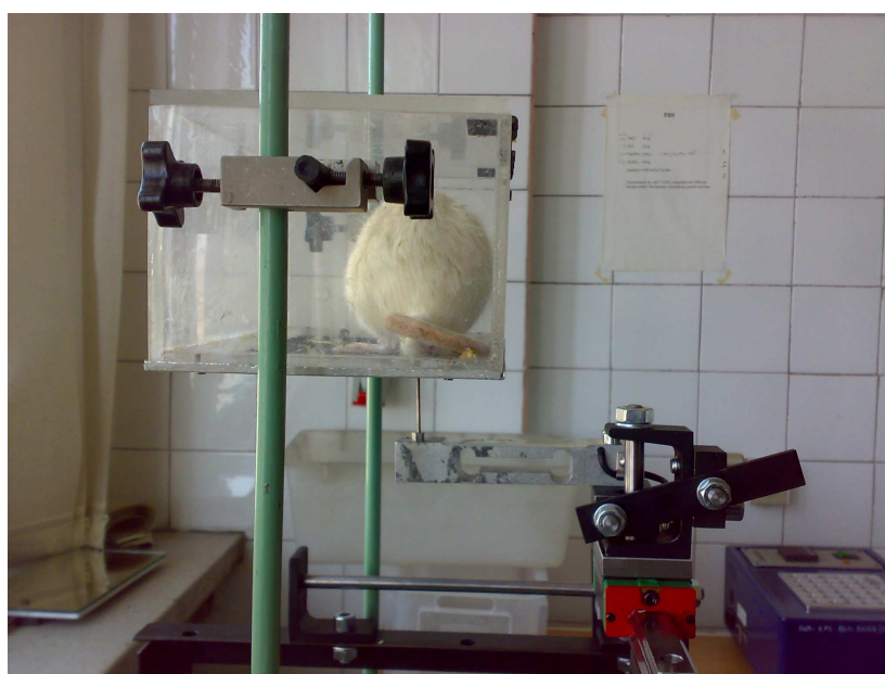
Rys .3. Pierwsze badania w warunkach laboratoryjnych przy użyciu nowego urządzenia

Przeznaczeniem urządzenia jest pomiar reakcji nacisku stopy zwierzęcia na końcówkę rejestrującą, a następnie przekazanie tej informacji do komputera celem dalszych analiz. Zwierzę po urazie rdzenia kręgowego doznaje porażenia tylnej kończyny, czego konsekwencją jest między innymi zaburzenie funkcji receptorów czucia. Specjalistyczne leczenie pozwala na przywrócenie funkcji kończyny tylnej. Z punktu widzenia skuteczności metod leczenia bardzo istotna jest porównawcza analiza ilościowa różnych zastosowanych w leczeniu metod. W trakcie pomiaru następuje uklucie stopy szczura siłą rejestrowana przez układ pomiarowy. Siła uklucia wzrasta do momentu reakcji zwierzęcia na ból. W chwili odstawienia stopy pomiar jest przerywany, a maksymalna wartość jest porównywana z wynikami kolejnych badań.