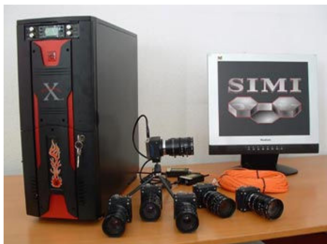
Rys. 2.4. Urządzenia systemu SIMI MOTION [8]

System pozwala na rejestrację parametrów ruchu człowieka z częstotliwościami 50, 100, 150 i 200, a nawet 300 Hz. W pełni zintegrowany system Simi Motion wykorzystuje najczęściej 6 kamer optycznych, okablowanie i komputer (stacjonarny lub przenośny) z zainstalowanym oprogramowaniem [8]. Informacje ze wszystkich kamer oraz dane analogowe docierają do jednostki w tym samym czasie, co pozwala na podjęcie natychmiastowej analizy. Istnieje możliwość wykupienia licencji zezwalającej na obserwowanie analizy wideo na dodatkowych 4-6 komputerach stacjonarnych [8]. Urządzenia wchodzące w skład standardowego systemu Simi Motion przedstawiono na rys. 2.4.