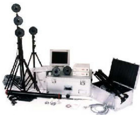
Rys. 2.1. Urządzenia systemu BTS Smart [7]

System BTS Smart to specjalistyczny precyzyjny system do trójwymiarowej analizy ruchu człowieka. Stanowi on kompletny system do odbierania i analizowania sygnałów wykorzystując przesyłanie sygnałów w podczerwieni i technologię optoelektroniczną. System może być skonfigurowany z 1-9 nowoczesnych kamer, które mogą pracować z częstotliwością 50/60/120/240 Hz. Ilość urządzeń w zestawie uzależniona jest od wymagań oraz zakresu badań, jakie planuje przeprowadzać jednostka kupująca dany system [4,7]. Na rysunku 2.1 przedstawiono urządzenia systemu BTS Smart.