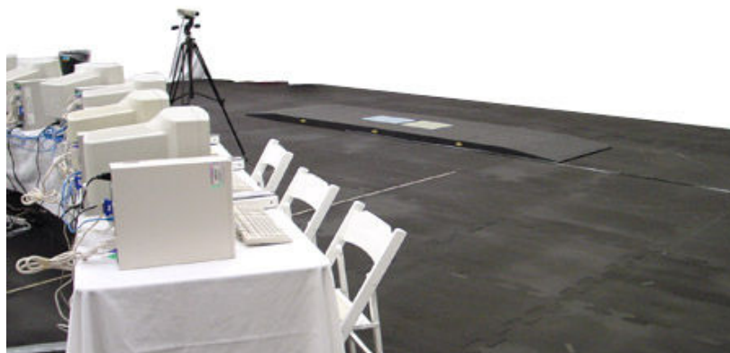
Rys. 2.2. Przykładowe stanowisko do rejestracji ruchu za pomocą systemu VICON [9]

System Vicon umożliwia przestrzenną wizualizację współpracy układów kostnego i mięśniowego, która jest otrzymywana poprzez rejestrację, rozmieszczonych na ciele badanego biernych retrorefleksyjnych markerów za pomocą optycznych kamer cyfrowych o rozdzielczości do 4 milionów pikseli [3]. Każda kamera wyposażona jest w procesor, a zatem część wstępnego przetwarzania odbywa się już w kamerze. Następnie zarejestrowany obraz jest integrowany z sygnałami analogowymi i tak trafiają do komputera obliczeniowo-sterującego [9]. Rysunek 2.2 prezentuje przykładowe stanowisko do rejestracji ruchu z wykorzystaniem systemu Vicon.