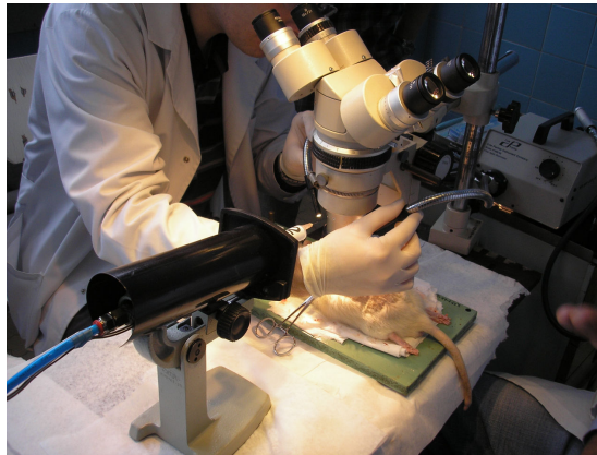
Rys.5. Pierwsze próby badań z wykorzystaniem urządzenia

Po wykonaniu prototypowego urządzenia przeprowadzono testujące próby. Poniżej przedstawiono zdjęcia z operacji przeprowadzanej przez pracowników Śląskiej Akademii Medycznej.