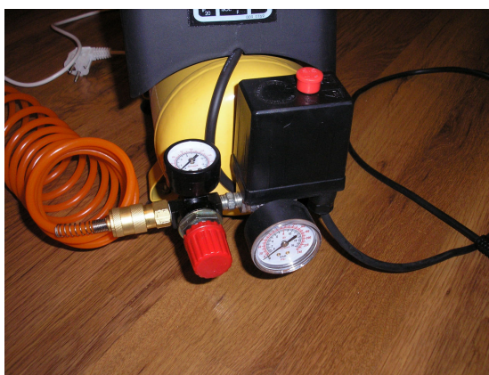
Rys.3. Kompresor wraz z reduktorem i wyłącznikiem ciśnieniowym

Wtryskiwacz zasilany jest sprężonym powietrzem podawanym z kompresora. Na wyjściu kompresora znajduje się reduktor umożliwiający nastawienie ciśnienia podawanego na elektrozawór z dokładnością do 0,2 bar. Układ wysokiego ciśnienia zabezpieczony jest zaworem bezpieczeństwa. Kompresor przedstawiono na rys. 3.