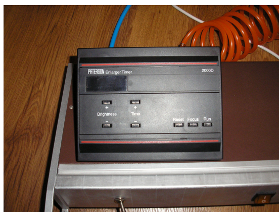
Rys.1. Jednostka sterująca otwarciem wtryskiwacza

Aby to zapewnić zastosowano sterowanie oparte o elektronikę cyfrową, dające możliwość ustawienia czasu otwarcia zaworu z dokładnością do 0,1s. Czas otwarcia jest programowany w zakresie od 0,1 do 99s ze 100% wypełnieniem impulsu. Jednostkę sterującą przedstawia rysunek 1.